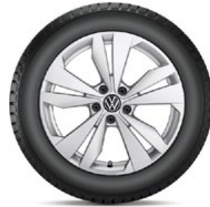
VW Loen Silber