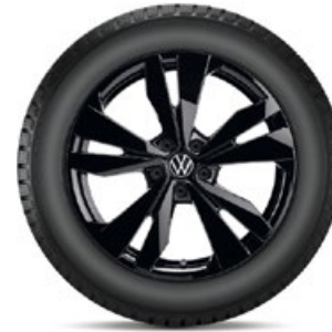
VW Loen Schwarz