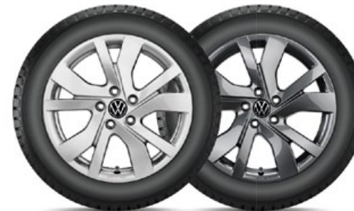
VW Rockingham Silber

VW Huntsville Silber für den neuen Tiguan in 19" mit 235/50 R19 103V XL Bridgestone Blizzak LM005 statt 3.600,- mit TopCard 2.700,- KE: C | NHK: A | GE: 72 | GE/G: B | SK-F: Nein Art.-Nr. 2355019HV40005